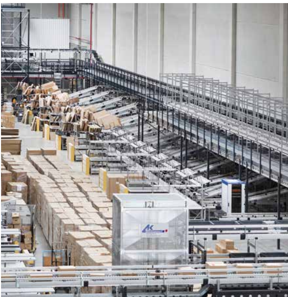
20 automatisch angebundene Packplätze