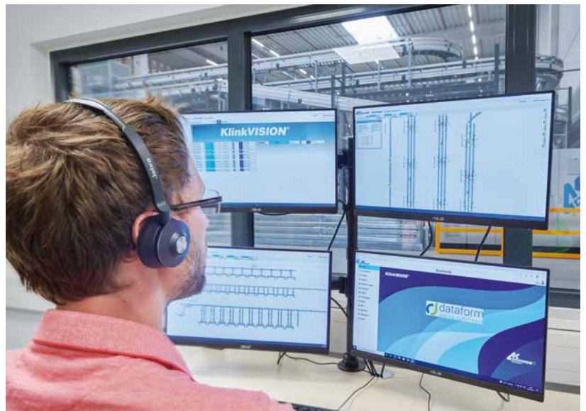
Lagerverwaltungssoftware KlinkWARE® und Visualisierung KlinkVISION®