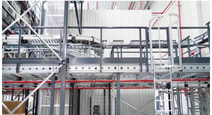
Auftragszusammenführungspuffer mit 1.084 Behälterstellplätzen