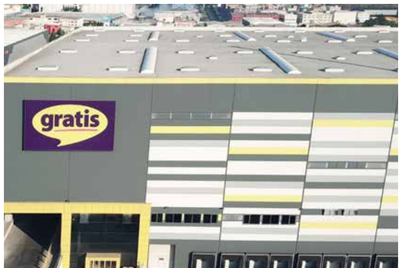
Distributionszentrum der Drogeriemarktkette mit 600 Filialen