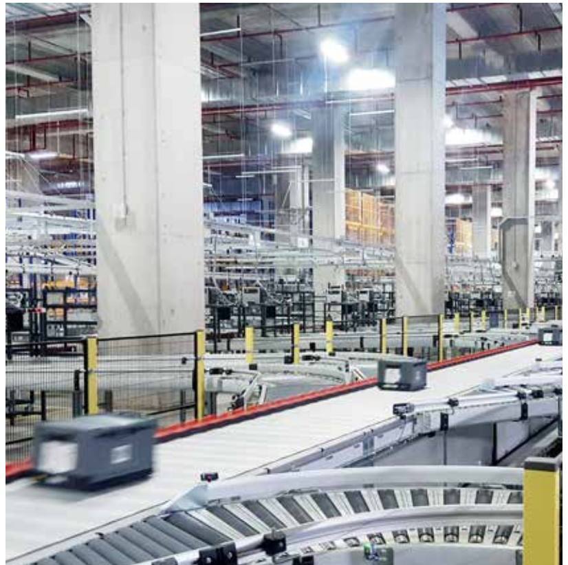
Sortersystem mit 42 Auslagerstichen