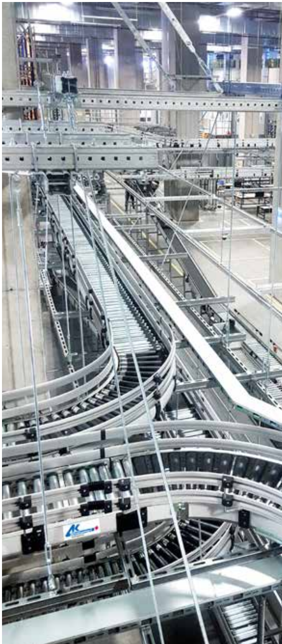
2 km Hochleistungs-Fördertechnik steuert den Materialfluss vom Orderstart bis zum Versand