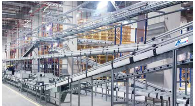
E-Commerce-Tower mit Fördertechnikbindung