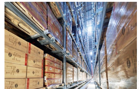
Siebengassiges AKL mit Auftragszusammenführungspuffer und Durchlaufkanälen