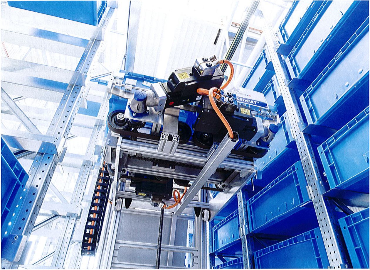
Ein Klincat-Multilevel-Shuttlelager ist für Frischwaren vorgesehen.

hohe Flexibilität und Schnelligkeit bei der Auftragsbearbeitung. Das temperaturgeführte Frischwarenlager ist daher mit drei übereinander liegenden Klincat Multilevel-Shuttles versehen, die jeweils sechs Behälterebenen erreichen. Das Shuttlelager zeichnet sich durch eine kompakte Bauweise und ein geringes Gewicht aus und bietet eine höhere Durchsatzleistung als das mit konventionellen Regalbediengeräten ausgestattete automatische Trockenwarenlager. Im Vergleich zum automatischen Kleinteilelager sorgt das Shuttlelager trotz halbem Flächenbedarf für 30 Prozent mehr Leistung. Gerade bei schnell-