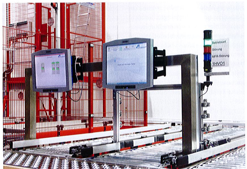
Kommissionierarbeitsplatz in der Fördertechnik-Vorzone mit Warehouse Management System.

Die Klinkhammer-Lagerverwaltungssoftware wird um die Verwaltung des Trocken- und Frischwarenlagers erweitert und an das bestehende Host-System angebunden. Bei Gewichtsware, wie etwa Rehkeulen mit unterschiedlichem Einzelgewicht, ist eine Erfassung der tatsächlichen Nettogewichte nun möglich. Hierzu werden Barcodes auf der Ware mit Nettogewichten gescannt und summiert. Der Klinkhammer-Materialflussrechner steuert die Transporte der Tablare und die Stellplatzverwaltung. Das Visualisierungssystem Klinkvision bringt Transparenz ins Lager und ermöglicht eine schnelle Fernwartung. Die Anlage soll im Frühjahr 2020 in Betrieb genommen werden. ▶