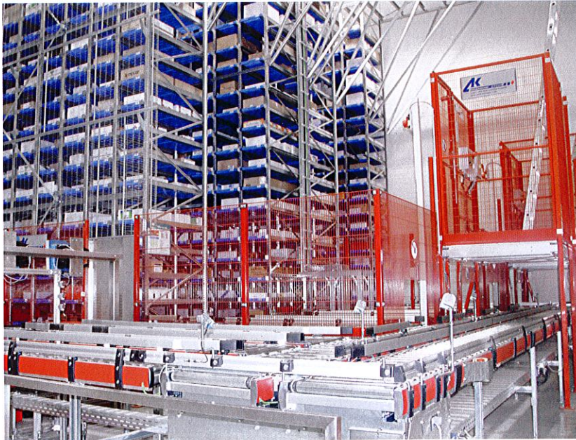
Das automatische Tiefkühlager in Tablartechnik mit Vorzone.

Anschließend werden die B-, C- und D-Artikel am Warenausgangplatz des Automatiklagers mit der bereits kommissionierten Ware zusammengeführt. Da die Produkte ab diesem Zeitpunkt im temperatgeführten Bereich bleiben, ist eine unterbrechungsfreie temperatgeführte Lagerhaltung gewährleistet.