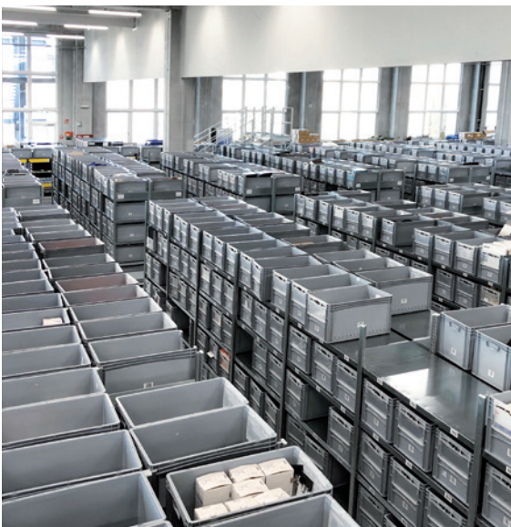
Fachbodenlager, 14.000 Behälter