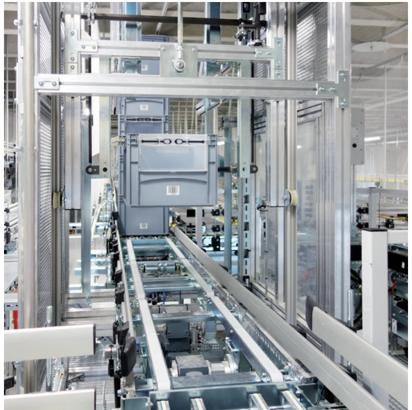
Leerbehälterspeicher mit Stapler