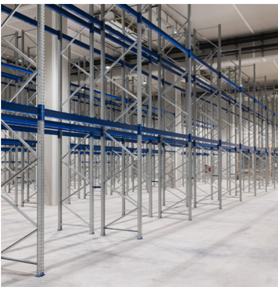
Stellplätze im Trocken- und Frischelager