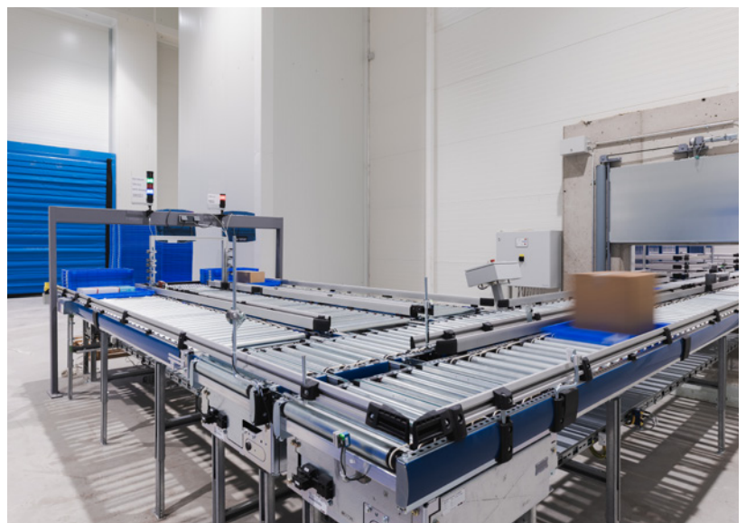
Kommissionierbereich im temperaturoptimierten Arbeitsbereich