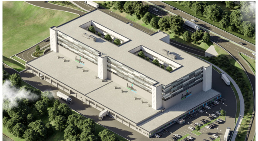
Kofler Center in Tirol