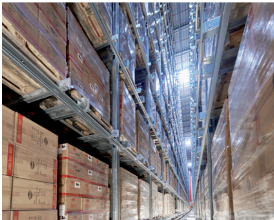
2-gassiges, fünffachtiefes Kanallager