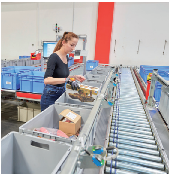
Multi-Order-Picking von bis zu 8 Aufträgen gleichzeitig