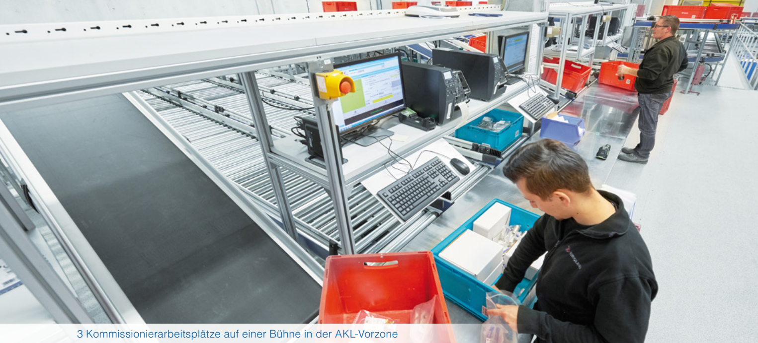
3 Kommissionierarbeitsplätze auf einer Bühne in der AKL-Vorzone